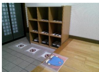
玄関にも学びの機会が用意してあります