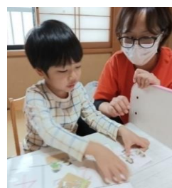
ねらいに合わせて様々な机上課題も行っています