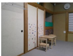
アットホームな環境で支援を行っています