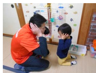
発語支援プログラムの様子です