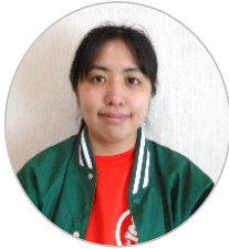
児童発達支援管理責任者

大切なお子様の未来をより良い方向へ変えるため、悩んでいる保護者様のため、私たちは全力でみなさんをサポートいたします！ ひとりで思い悩まずに、ぜひお気軽にご連絡ください。