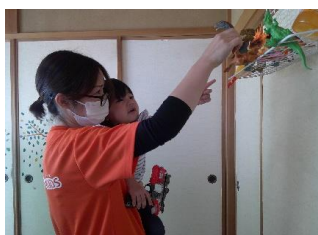
発語を促す環境の工夫をしています