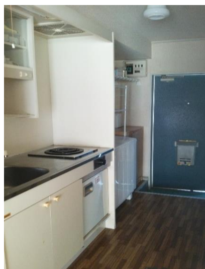
コンロ、洗濯機も 備え付きです。