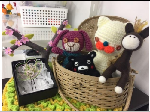
写真のカゴも作成したものです