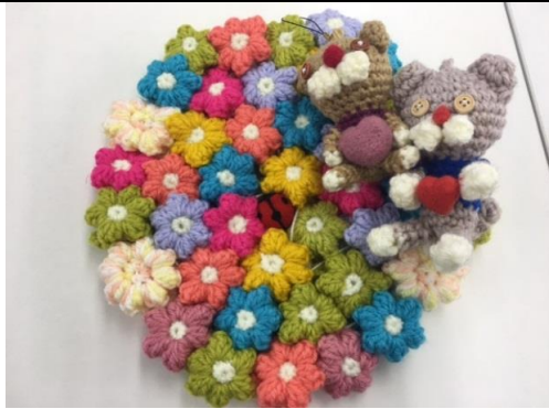
編み物で多種多彩な作品を作ります