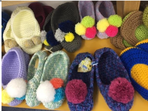
可愛いスリッパです