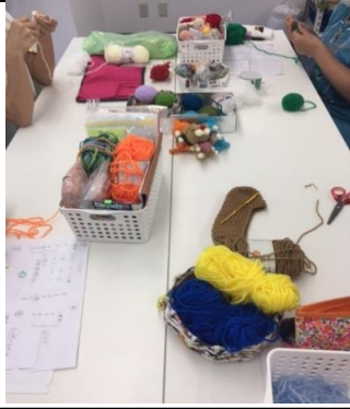
編み物の仕事の様子です