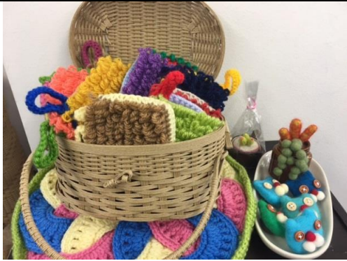
カゴの中の商品はアクリルたわしです