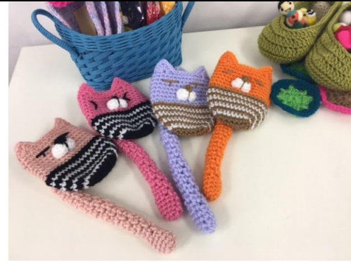
こちらもアクリルたわしです