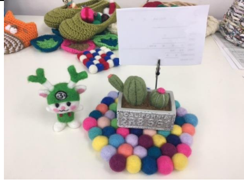
ペーパースタンドも手作りです