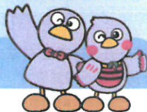
埼玉県マスコット コバトン&さいたまっちょ