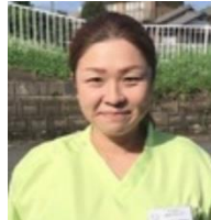
デイサービス 管理者兼生活相談員