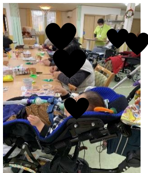
共生型デイサービス 医療処置があっても安心して 過ごす事ができます。