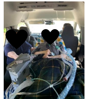
介護タクシーの様子