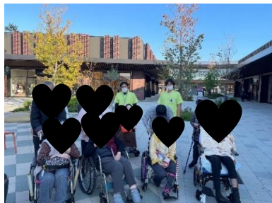
天気の良い日には外出レクに行きます★