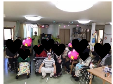
季節の行事イベント♡