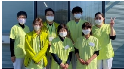
デイサービス 職員