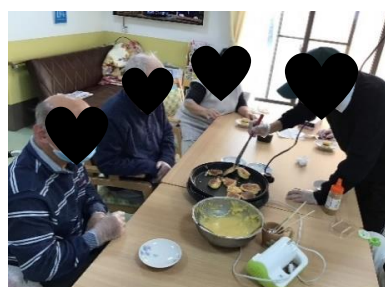
おやつレク 利用者様同士、楽しくレクに参加しています。