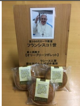
ローマ教皇に献上もさせていただきました