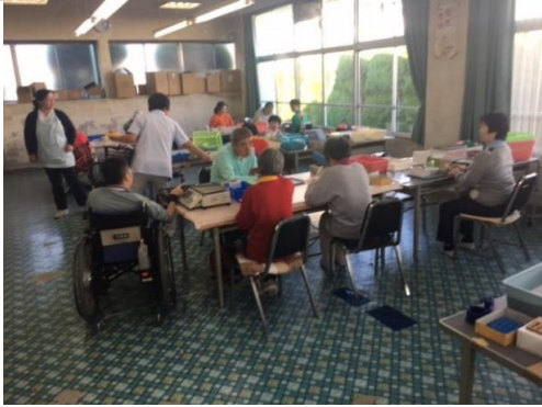
ネジの袋詰め作業です