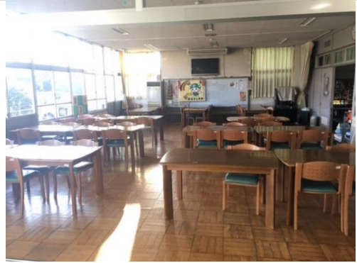
広々とした食堂です