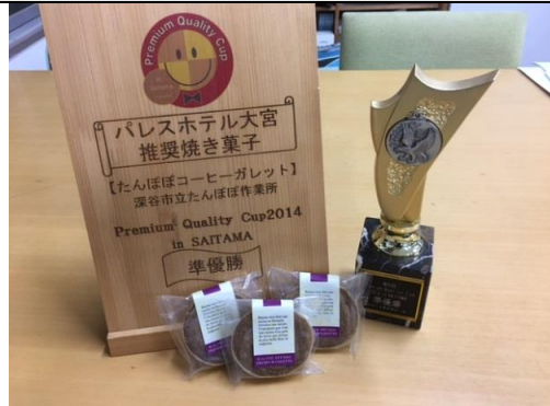
たんぽぽコーヒーガレットは2014年に準優勝でした