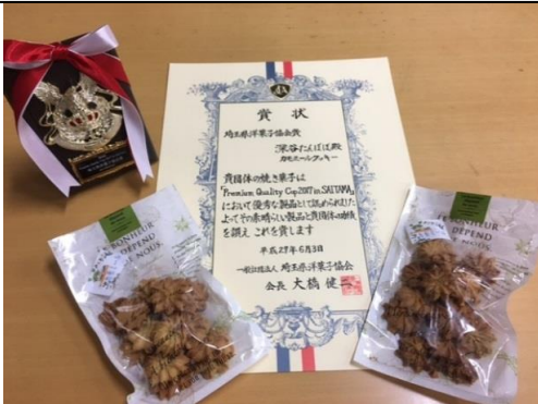
今年の焼き菓子コンテストで特別審査員賞を受賞したカモミールクッキーです