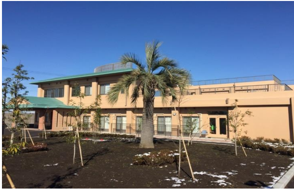
お庭はとても広いです