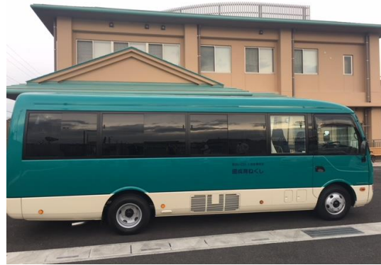
H29年11月にマイクロバスが新車が来ました