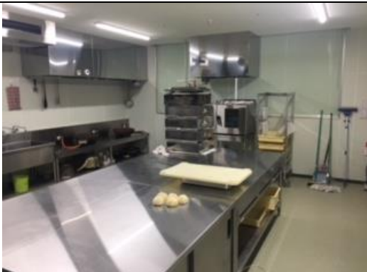
就労継続支援B型で作っている『たんさんまんじゅう』です。