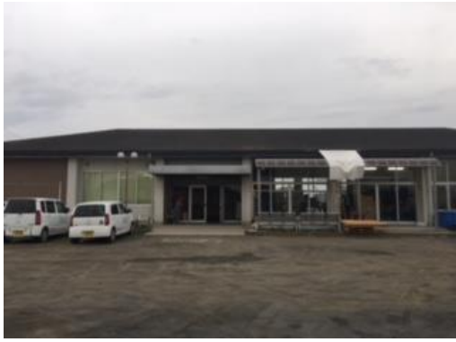
別棟にも作業場があります