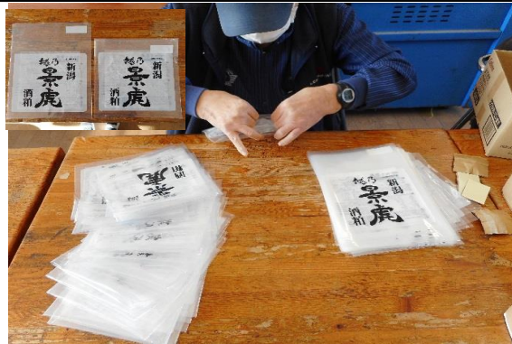
袋折りの作業です