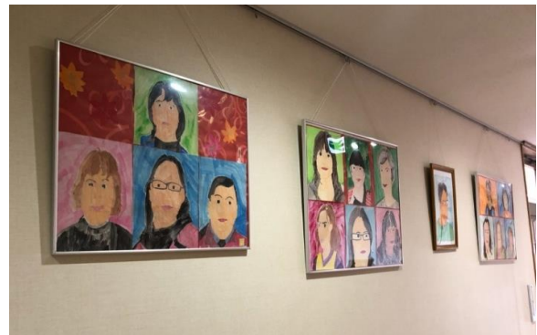
ピクチャーレールが各所にあり、作品がたくさん飾ってあります