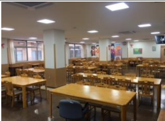
食堂も広々としています