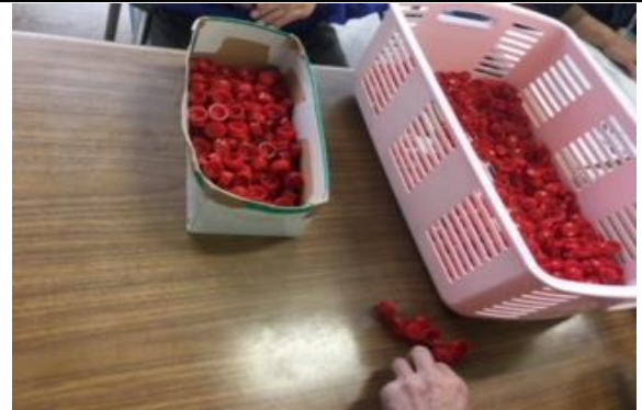
キャップの組立て作業です