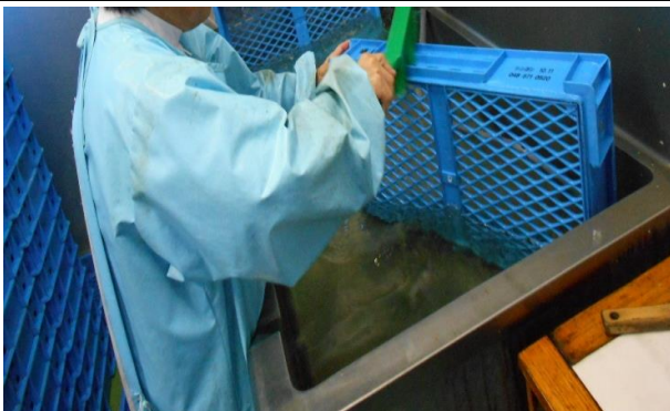
コンテナ洗浄作業