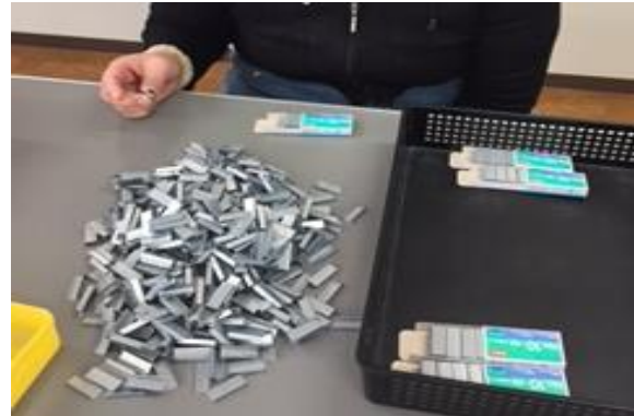
ホチキス針の箱詰めです