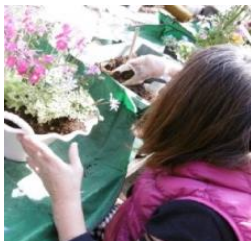
園芸で寄せ植えをしています