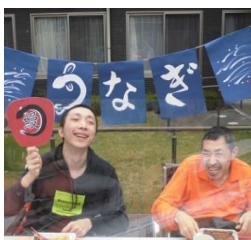
うなぎ屋春日園店へいらっしゃい