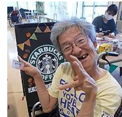
春日園にあの有名なカフェが！？