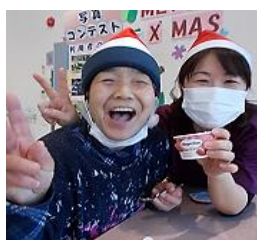
行事は盛り上がります