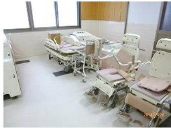
特殊浴槽3台と一般浴槽で身体機能にあわせて5形態の入浴方法で行います