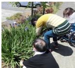
しょうぶ湯用の菖蒲を収穫