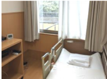
すべての部屋が庭に面しています