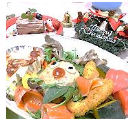
クリスマスメニュー♪よく見るとトナカイが!!