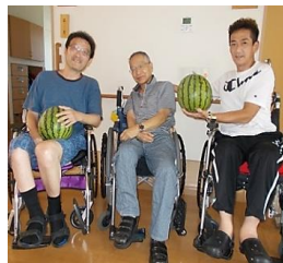
今年も立派なスイカが育ちました！