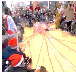
リボンをひっぱると何のプレゼントが出てくるかな～？