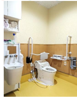
多機能のトイレです