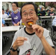
中庭で夏祭りをを行い、お団子を食べました。