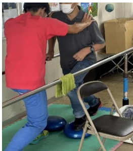
月、金曜日リハビリ活動を行っています。