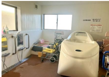
車いすのまま入浴できる機械浴槽です。