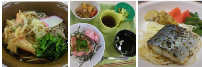
四季の色合いを考えた美味しい手作り給食です。