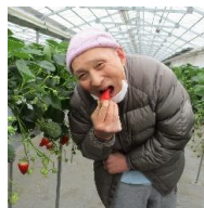
いちご狩りに行き、大きないちごを食べました。