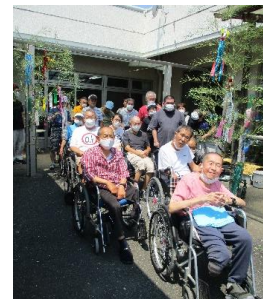
七夕様の飾りつけです。星に願いを込めました。