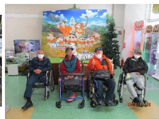
群馬サファリパークに行ってきました。