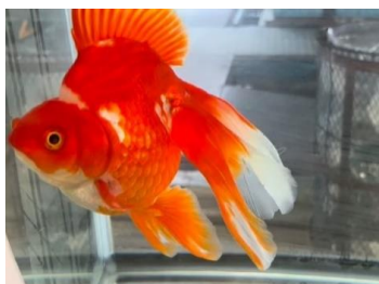
利用者さんが飼育している大きな金魚です。