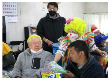
お客様を招き、歌や踊りを楽しみました。