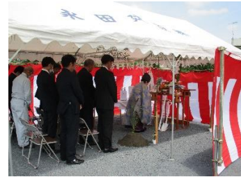
新棟建設に向けての地鎮祭の様子です。

対人関係、コミュニケーションなども、言葉使い、言動、どこに課題があるのかを考えながら調和を保てるように考えていきます。ストレスの発散なども含めてお互いに尊重できるように目指していきます。新棟棟が令和7年4月には建設予定です。どんな僚棟ができあがるかご期待くださいませ。