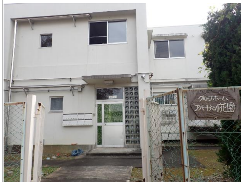
ゆったりすごせる食堂です