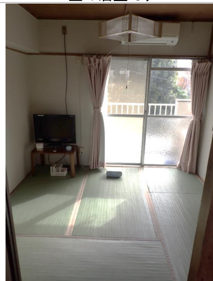
ホームからのお知らせ