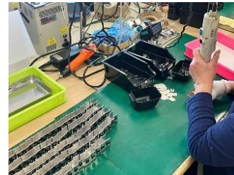
電子部品のネジ止め作業です。