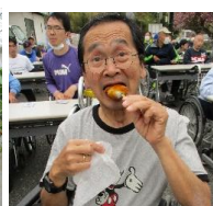
中庭で夏祭りを行い、お団子を食べました。