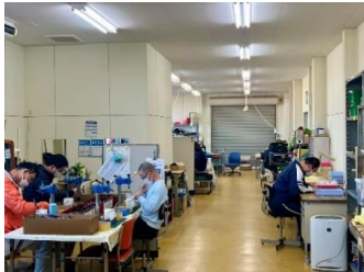
作業場の様子です。