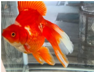
利用者さんが飼育している大きな金魚です。