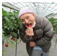
いちご狩りに行き、大きないちごを食べました。