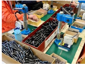
ボールペンの組立です。