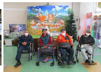
群馬サファリパークに行ってきました。