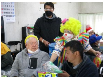
お客様を招き、歌や踊りを楽しみました。