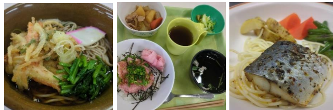
四季の色合いを考えた美味しい手作り給食です。